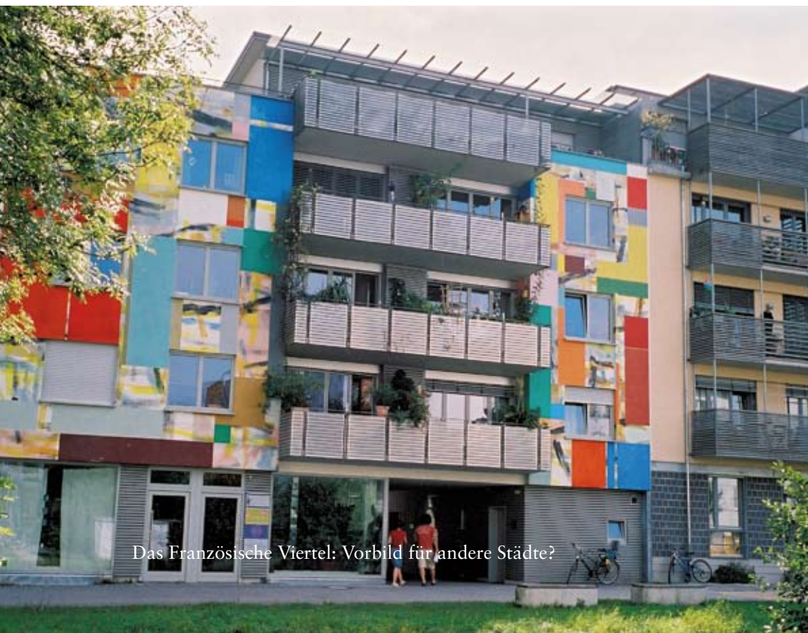
Das Französische Viertel: Vorbild für andere Städte?