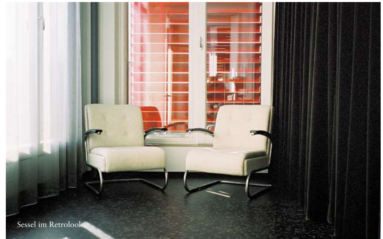
Sessel im Retrolook.