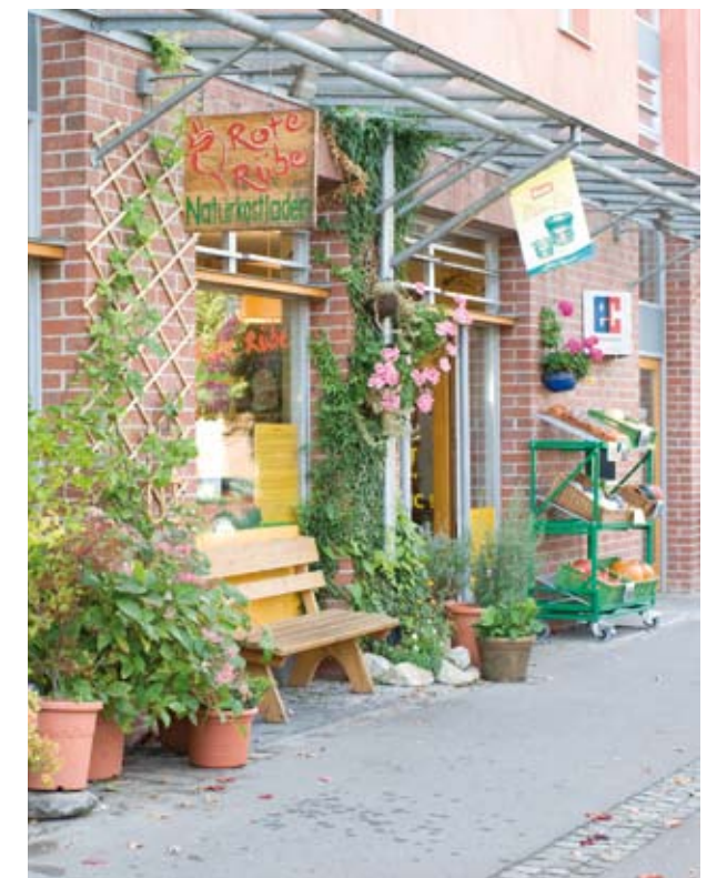
In der Stadt der kurzen Wege dürfen auch Läden nicht fehlen.