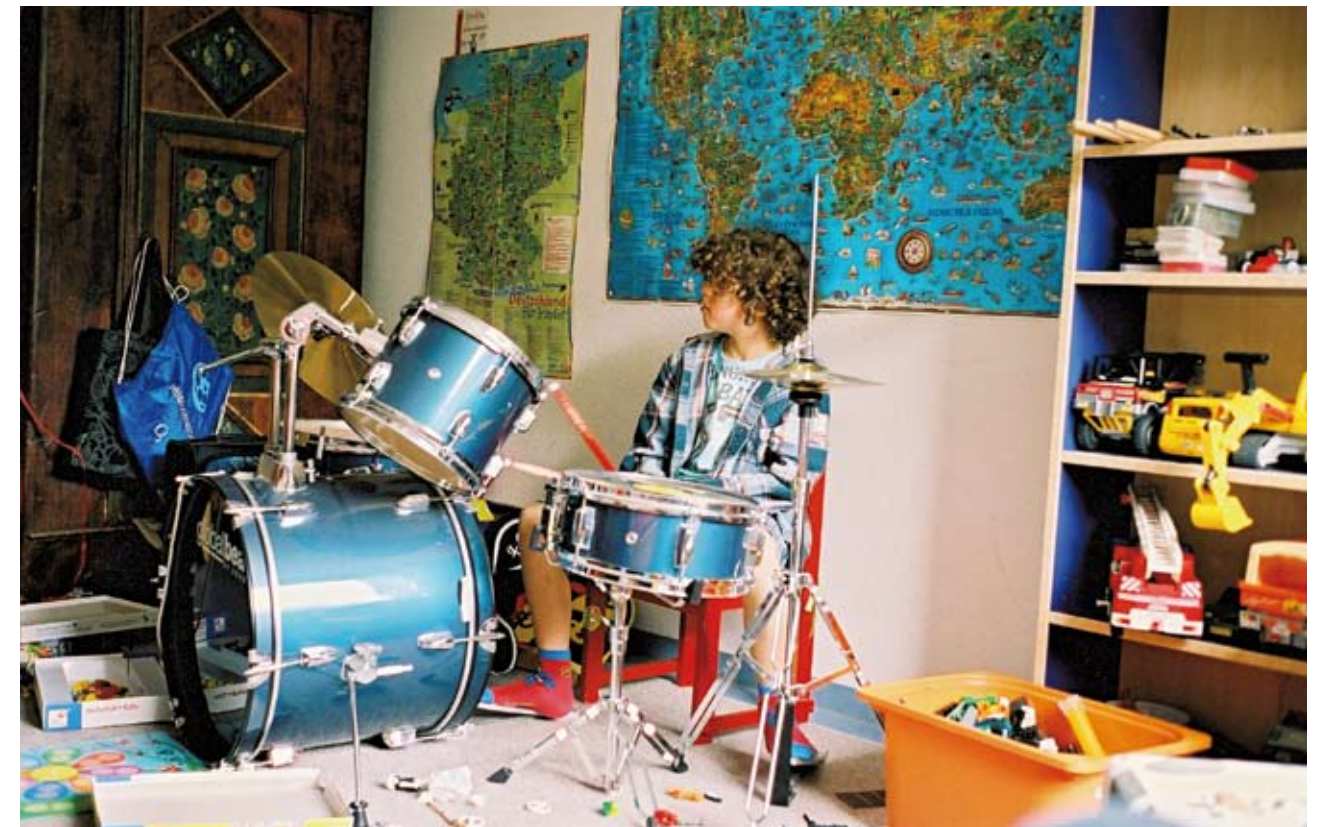
Ein echter Musikerhaushalt: der Nachwuchs am Schlagzeug.