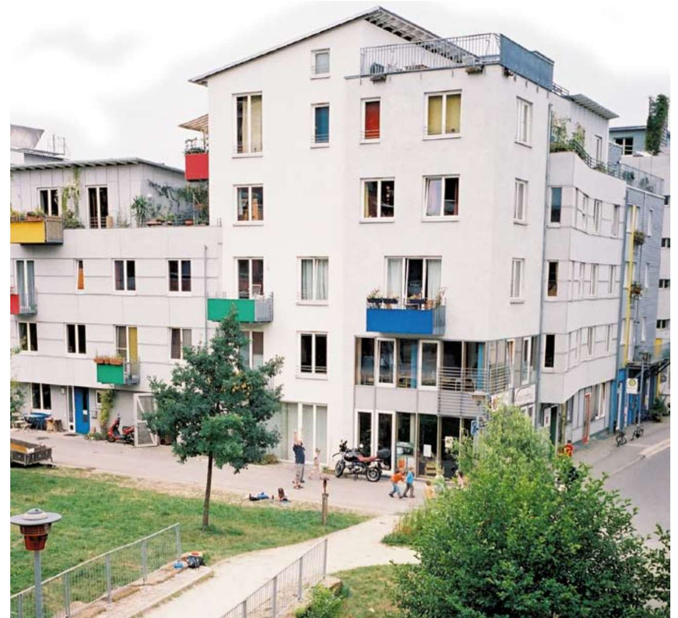
Hinter dem Französischen Viertel beginnt der Wald.