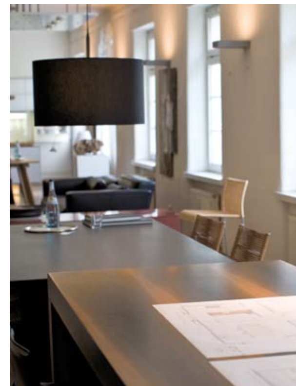
Die Schreinerei „Holz + Form“ gehörte zu den ersten Betrieben im Viertel.